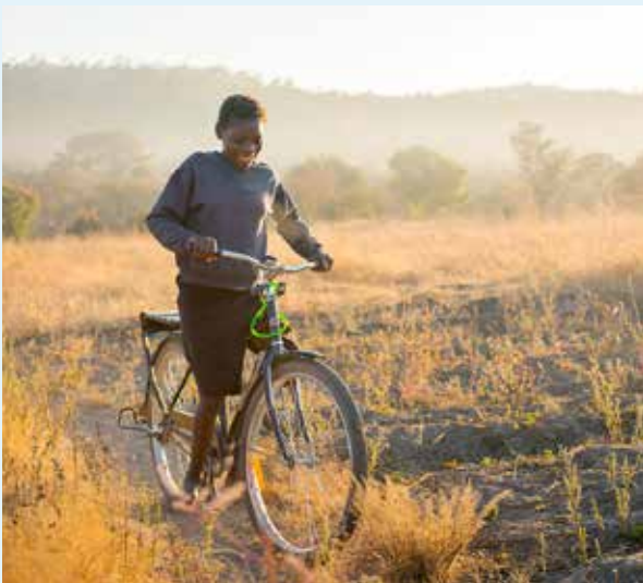
c/o World Bicycle Relief

Vélosophyn pyörät valmistetaan ensisijaisesti kierrätysalumiinista kiertotaloutta edistäen. Tavoitteena on yhdistää käytötavara ja sosiaalinen vastuu: tehdään massasta erottuva tuote, joka on enemmän kuin ”pelkkä” polkupyörä. Polkupyörät kasataan paikan päällä. Mahdollisuuksien mukaan myös pyörän runko voidaan valmistaa paikan päällä viljellystä bambusta paikallisen työn edistämiseksi.