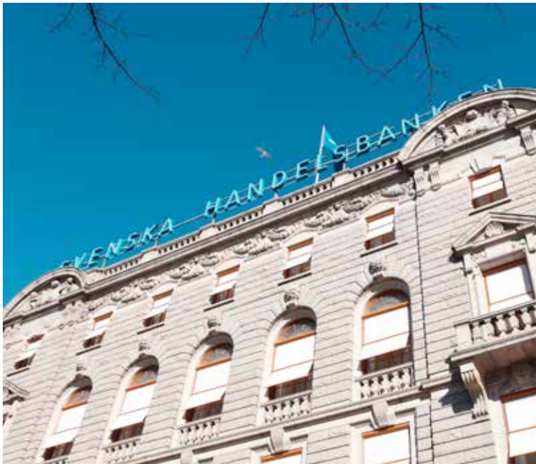
Handelsbanken on yksi Ruotsin suurimmista yhteisöveron maksajista.

Rauhanomaiset ja osallistavat yhteiskunnat luovat perustan kestäväälle kehitykselle. Talousrikollisuutta torjumalla Handelsbanken edistää talouskasvua ja vahvistaa luottamusta talousjärjestelmään, demokratiaan ja yleiseen turvallisuuteen.